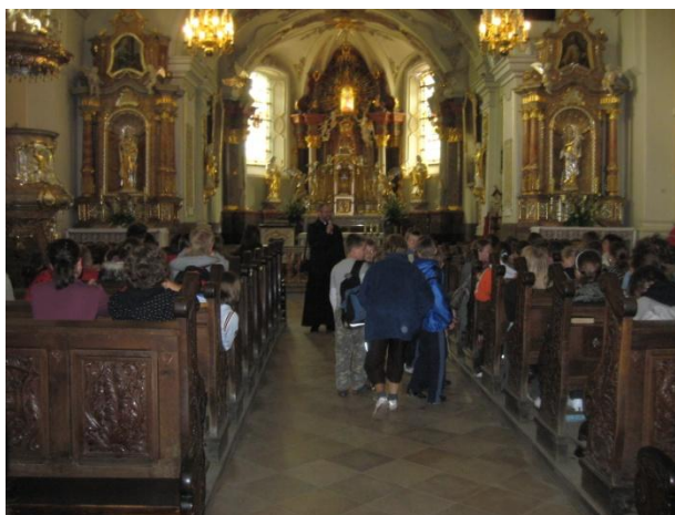
Przygotowanie do Mszy Św. w Bazylice Annogórskiej