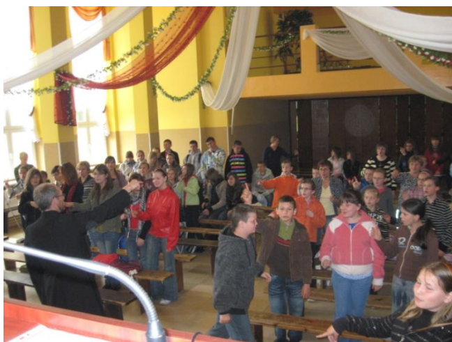
Wspólne śpiewanie w Domu Pielgrzyma